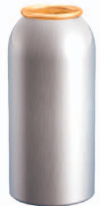
1 inch rund/round